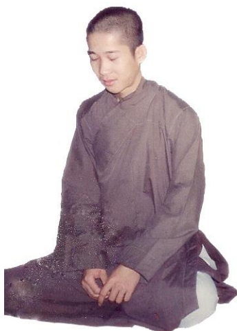
Thị Giả Mật Hạnh

Một hôm, trên tâm thanh tịnh đó xuất hiện Bốn Thần Túc, Thầy liền biết một cách rõ ràng, nhưng cái biết đó không phải là ý thức mà cái biết đó là thức uẩn nên Thầy dùng thần lực đó nhập bốn định Hữu Sắc và thực hiện Tam Minh. Thầy hoàn toàn làm chủ sanh, già, bệnh, chết và chấm dứt luân hồi sanh tử. Thầy biết rất rõ chỉ còn một đời sống này nữa mà thôi. Tâm Thầy không còn một chút tham, sân, si, mạn, nghi nào cả.