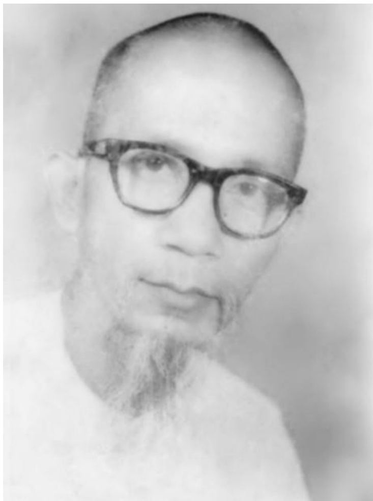
THẦY THÔNG LẠC (1983)